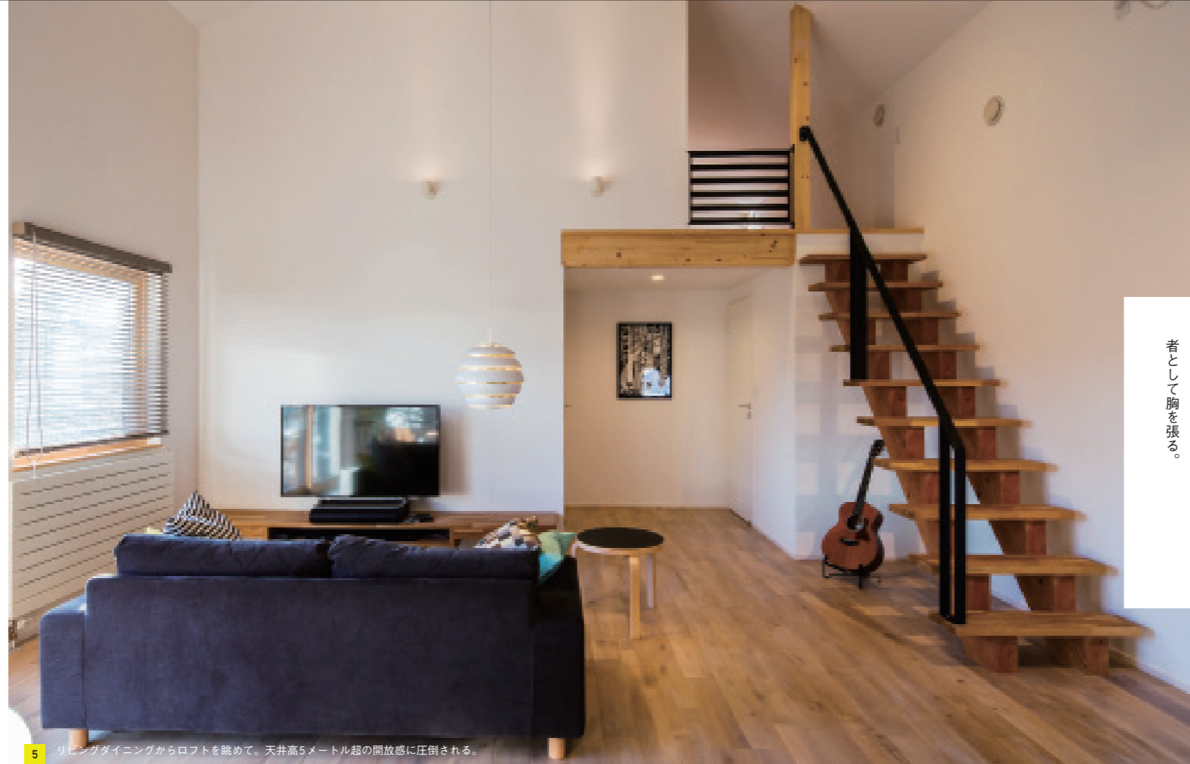
5 リビングダイニングからロフトを眺めて。天井高5メートル超の開放感に圧倒される。