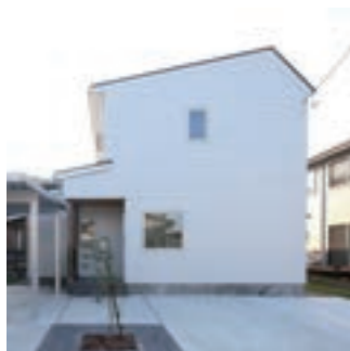
真っ白い外観の中央に存在するのがシンボルツリー。子どもの成長や家の歴史を見守ってくれる存在だ。